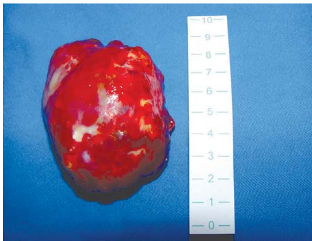
Fig. 2 - Aspecto e medida da neoplasia após ressecção completa